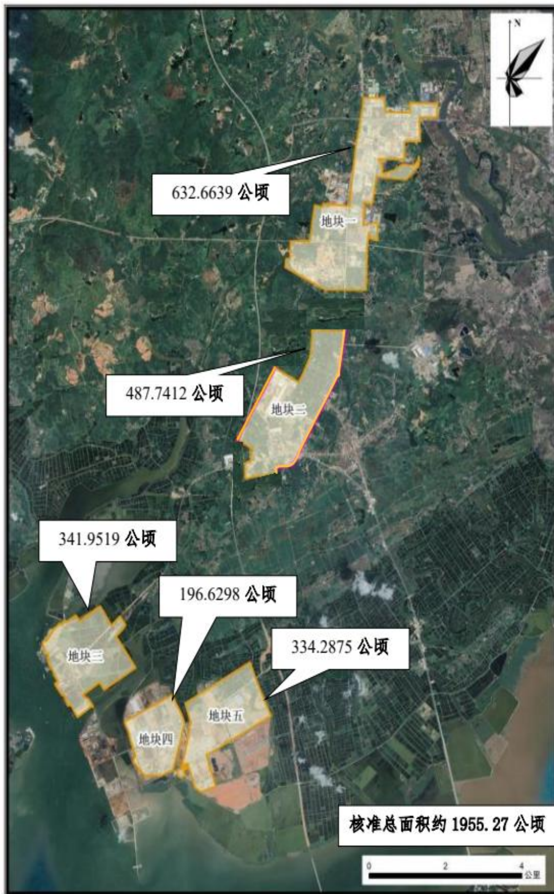
图 1.2-1 阳江高新产业技术开发区区块分布图