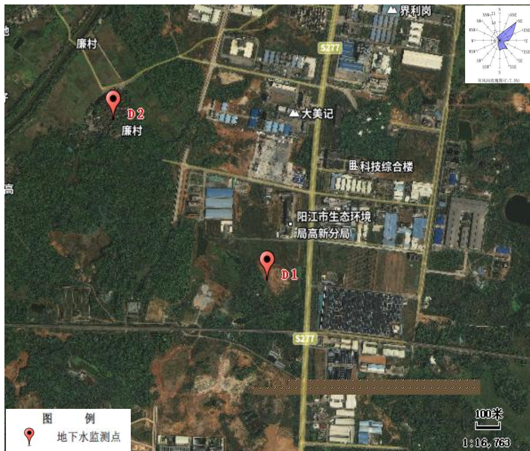
图 3.3-1 地下水监测点位示意图