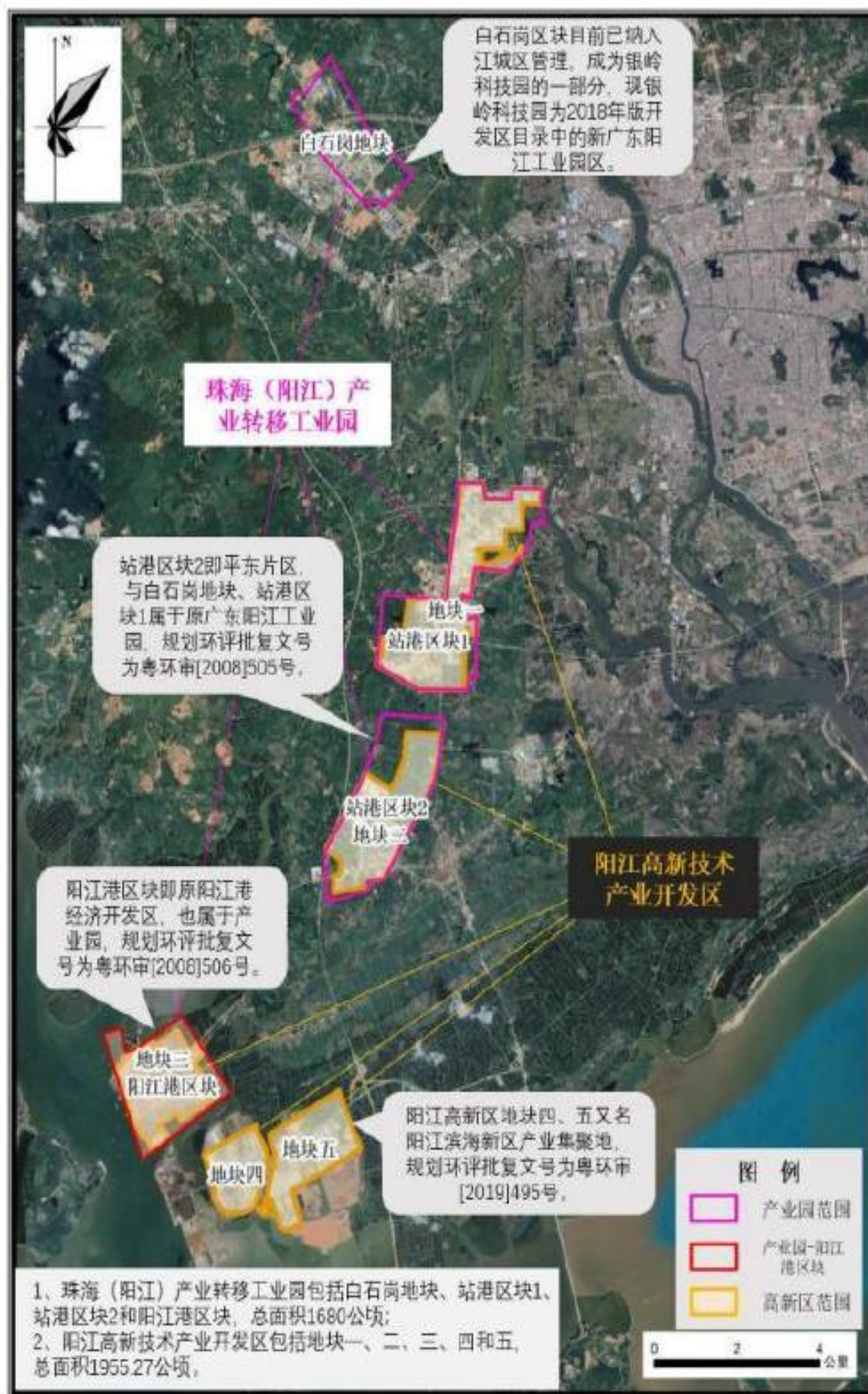
图 1.2-2 产业园与高新区的位置关系图